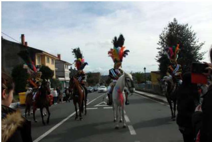
Los Xenerais del Ulla

En resumen, un par de días maravillosamente divertidos donde conocimos algo más del Carnaval.