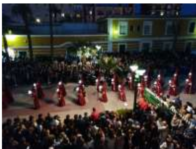
San Pedro en el Arsenal

Sin duda, merece la pena perderse en Cartagena, tanto por la ciudad, como por sus acogedoras gentes, y si es en Semana Santa, mucho mejor.