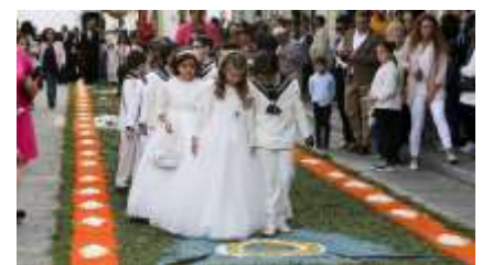
Ares (La Voz de Galicia)