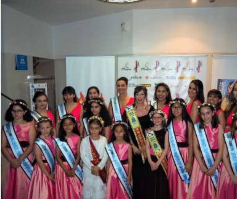
Las Fiestas del Aquelarre y del Solsticio Poéticos por Mimi Santos