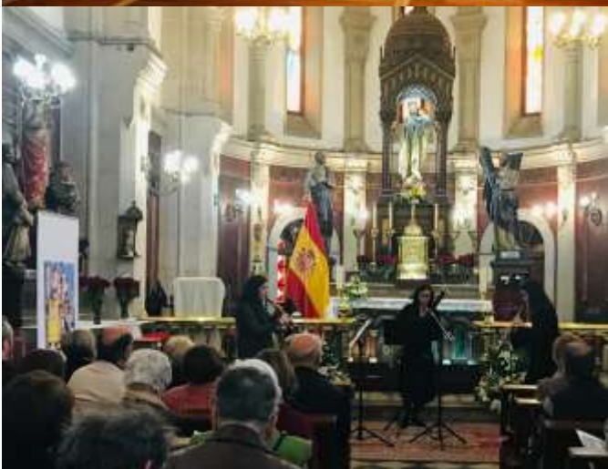
Ciclo de Teatro, Ciclo "Páginas Coruñesas", Presentación de los Trajes de gala de las Meigas, Ciclo "Voces Meigas" y Ciclo "Luminarias del Clasicismo"