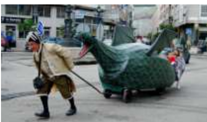
La Coca de Redondela

Este año, la celebración del Corpus coincide con la jornada del 23 de junio y será en la noche del 22 cuando estos tapices florales se hagan visibles. Es, pues, un buen momento para visitar cualquiera de estas tres localidades.