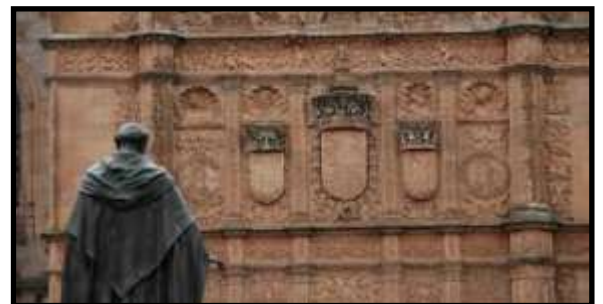
Conquista de América : origen de los Derechos Humanos