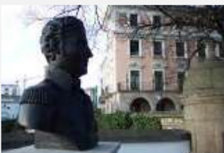
Busto de Sir John Moore en el Jardín de San Carlos.

por quienes la habitaban. Tras aquella aventura fue conocida como la Reina Blanca de Palmira.