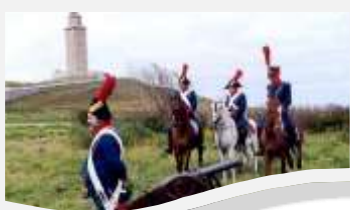
Recreación de La Batalla de Elviña