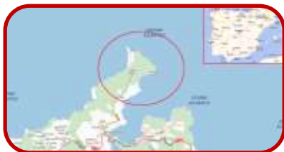
Estaca de Bares y entorno

Para alguien que viene del Mediterráneo las costas de Galicia son algo difícil de entender. Recortadas. Entrantes y salientes rocosos. Mar con mareas que suben y bajan siguiendo unas pautas variables según las estaciones pero conocidas por los mareantes desde hace siglos. El límite entre el agua salada del mar y la dulce de los ríos es confuso. No hay deltas sino estuarios. Los ríos son muchas veces rías. El mar entra en la tierra a horas