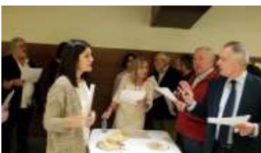
Meiga Mayor Belén Ferreiro