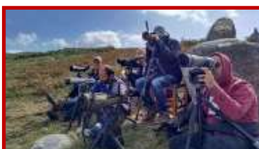
El paso de aves marinas por Estaca de Bares, un espectáculo único en Europa