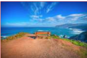
El banco mas bonito del mundo.