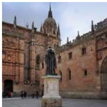
Escuela de Salamanca

“El emperador, aunque fuese dueño del mundo, no por ello podría ocupar las provincias de los bárbaros, establecer nuevos señores, deponer a los antiguos y cobrar tributos”