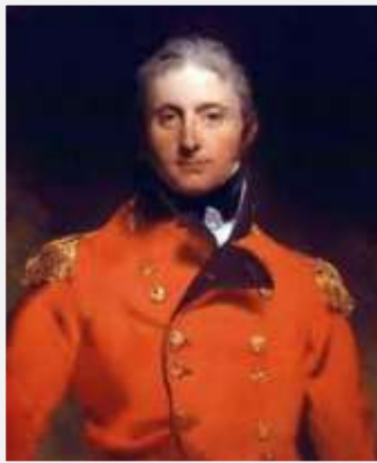
General Sir John Moore