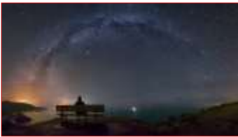
El banco mas bonito del mundo. Dani Caxete