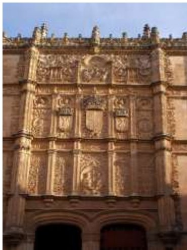
Escuela de Salamanca

EL PRIMER IMPERIO DEL DERECHO. FUNDADORES DE LA MODERNIDAD: LA ESCUELA SALMANTINA