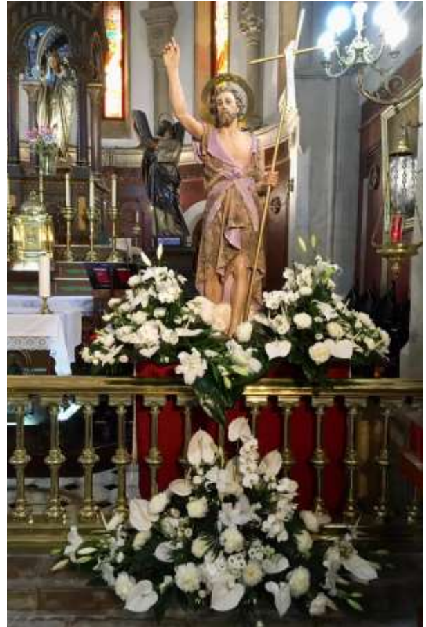
San Juan Bautista (Iglesia de San Andrés)

El "Cardo de Bronce", en la modalidad de colectivo, que le fue concedido a la Unidad de Música del Tercio del Norte de Infantería de Marina, le será entregado en el transcurso del concierto que ofrecerá el próximo día 16, a las 19,00 horas, en el Paseo del Parrote.