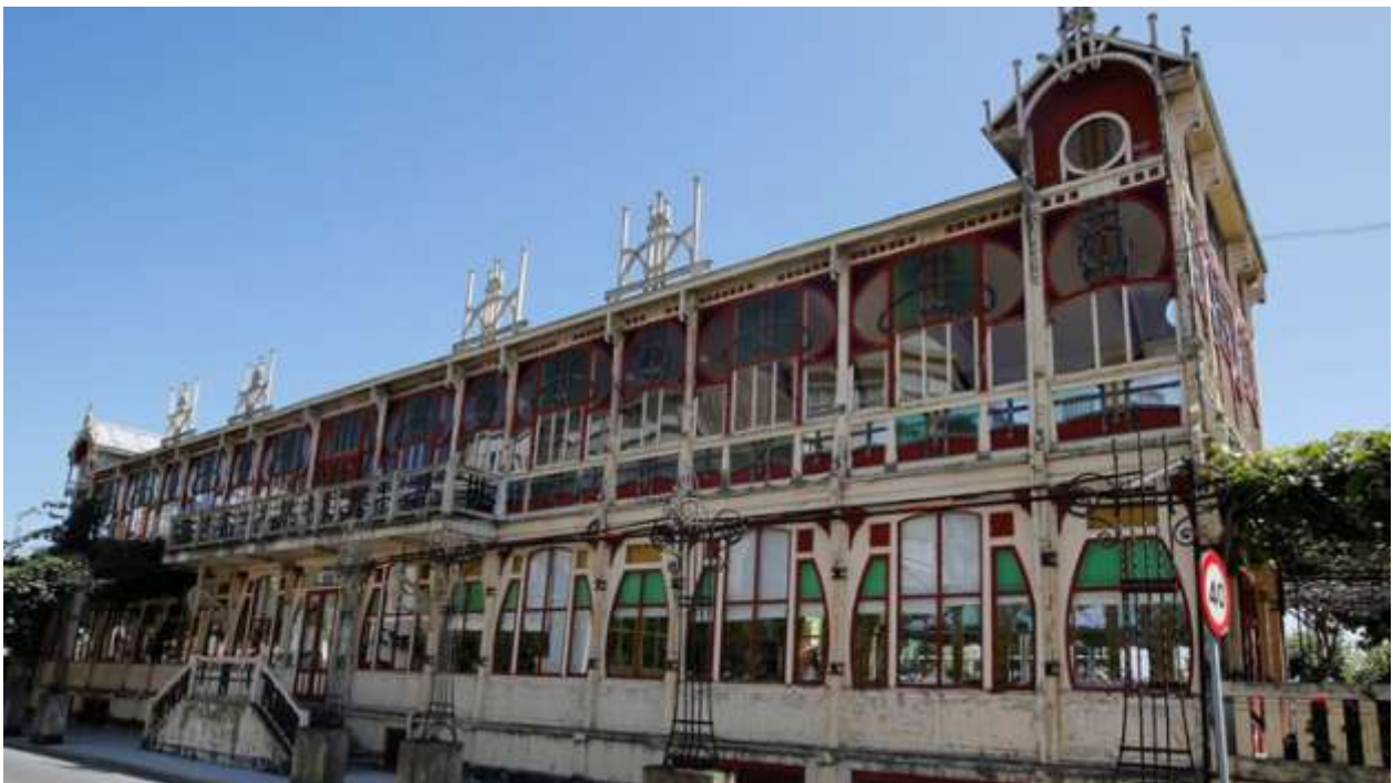
Primitivo edificio de La Terraza de La Coruña, situado hoy en Sada