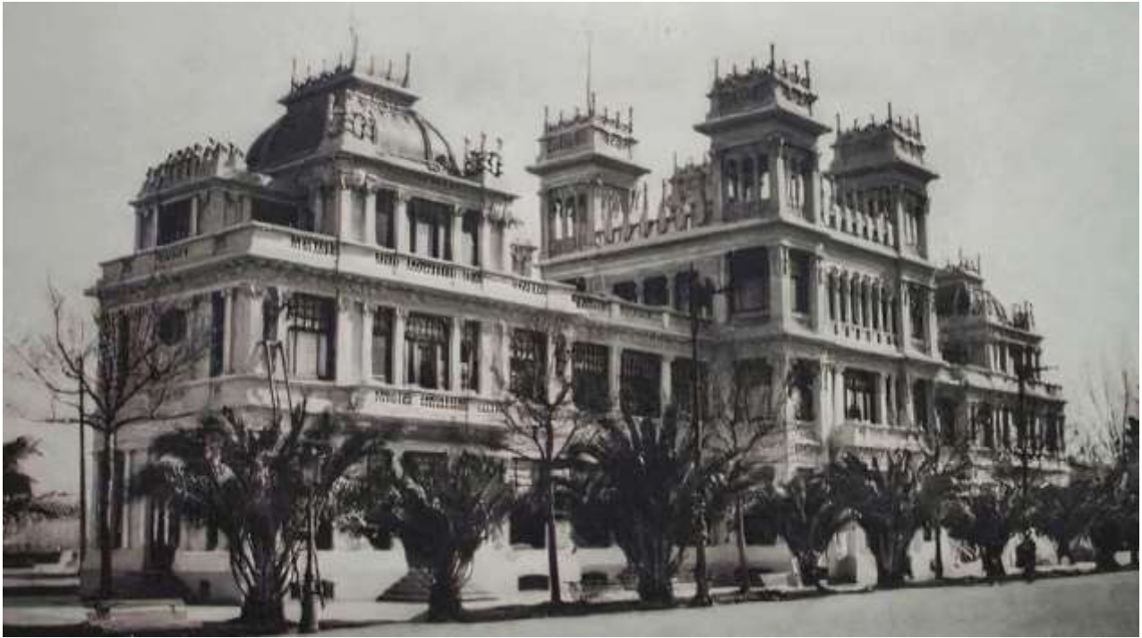
Edificio de La Terraza de La Coruña