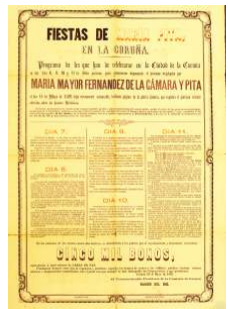
Programa de las Fiestas de María Pita de 1876