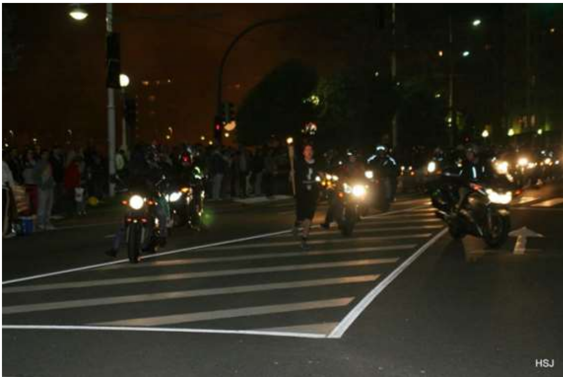
La Comitiva del Fuego de San Juan en el Paseo Marítimo