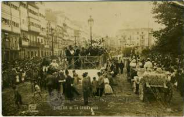
La Batalla de Flores recorriendo los Cantones abarrotados de gente

El mes de agosto de 1908, mes estival por excelencia, La Coruña, una de las ciudades más elegantes y animadas del tercio norte español, se vistió de gala para celebrar sus tradicionales fiestas de verano, organizadas por la Liga de Amigos.