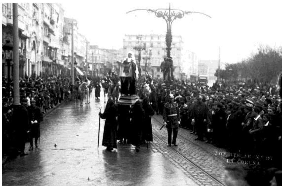
El paso de la “Santa mujer Verónica”, en la procesión del “Tránsito”