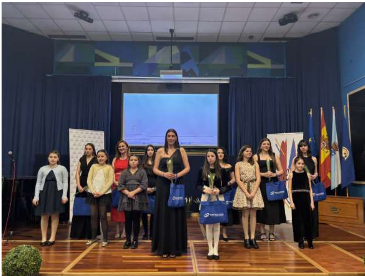
Foto de familia de las Meigas de las HOGUERAS-25

El pasado día 22, se celebró en la Sala de Cultura del Sporting Club Casino el acto de Elección y presentación de la Meiga Mayor de las HOGUERAS-25 .