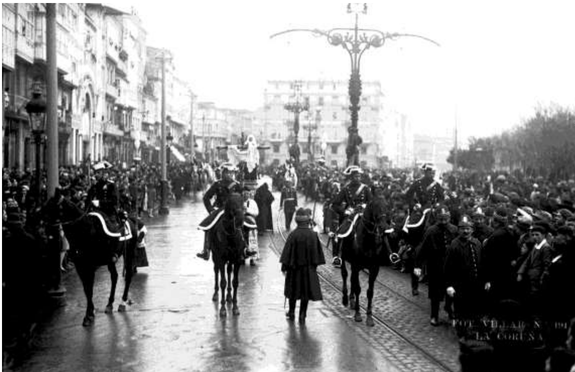
El inicio de la procesión del “Tránsito” en el Cantón Grande

La Semana Santa de 1931, última de la monarquía alfoncina, se celebró entre los días 29 de marzo, Domingo de Ramos, y 5 de abril, Domingo de Resurrección.