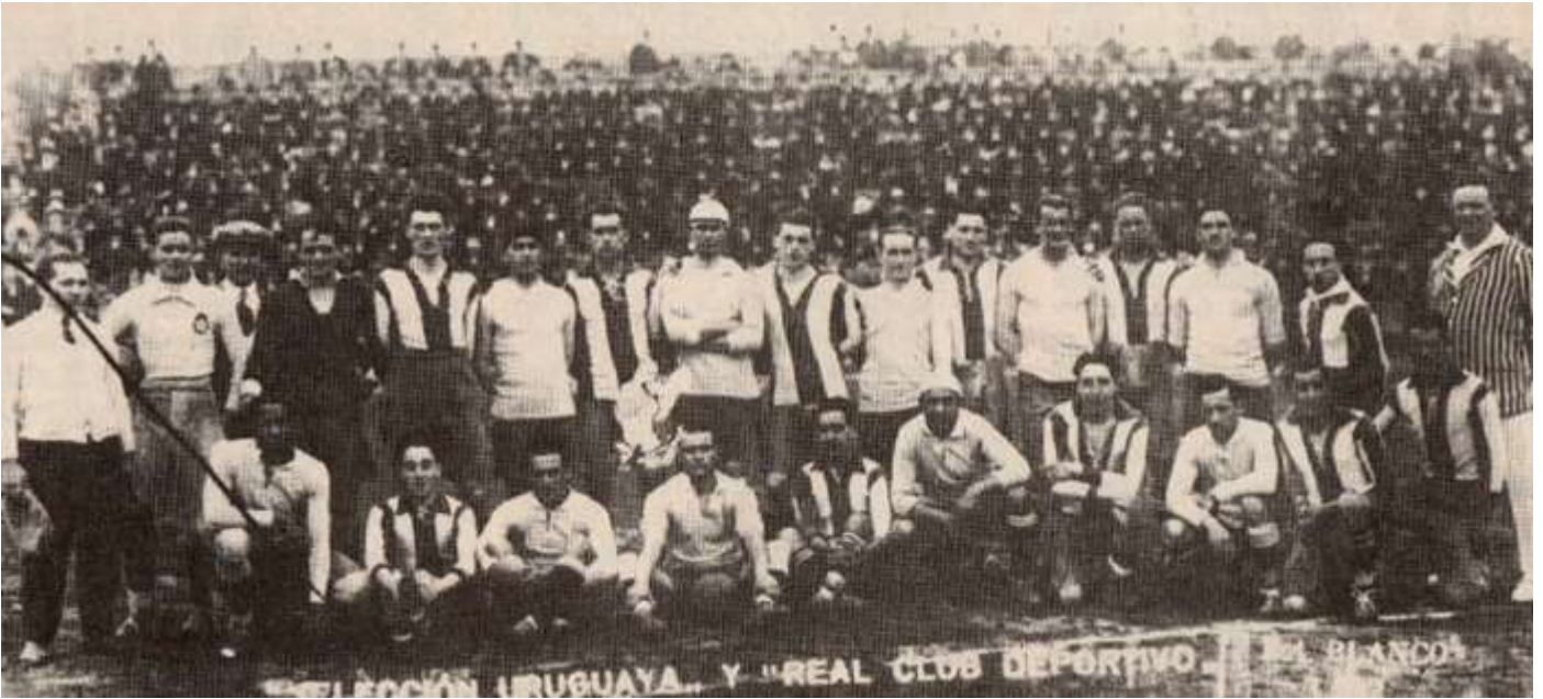
1924. Jugadores del Real club Deportivo y de la selección Uruguaya posan en el Parque de Sports de Riazor antes del encuentro que disputaron el 2 de mayo

El parque de Sports de Riazor fue testigo, en el mes de mayo de 1924, de un acontecimiento deportivo de categoría internacional. El Real club Deportivo se enfrentó a la Selección Nacional de Uruguay, que camino de los juegos olímpicos que iban a disputarse en París, había hecho escala en La Coruña, disputando dos encuentros amistosos los días 2 y 5 de mayo.