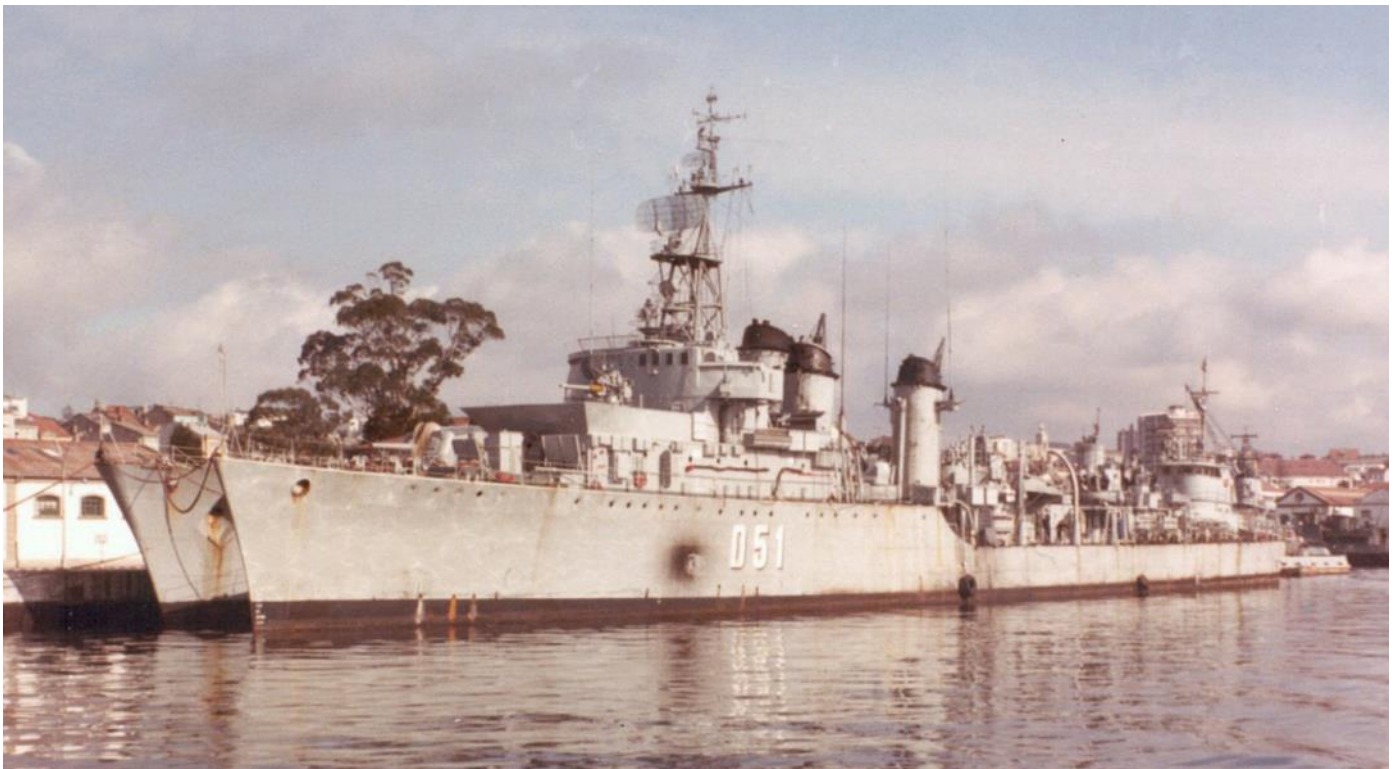
El Destructor "Liniers" (D-51)