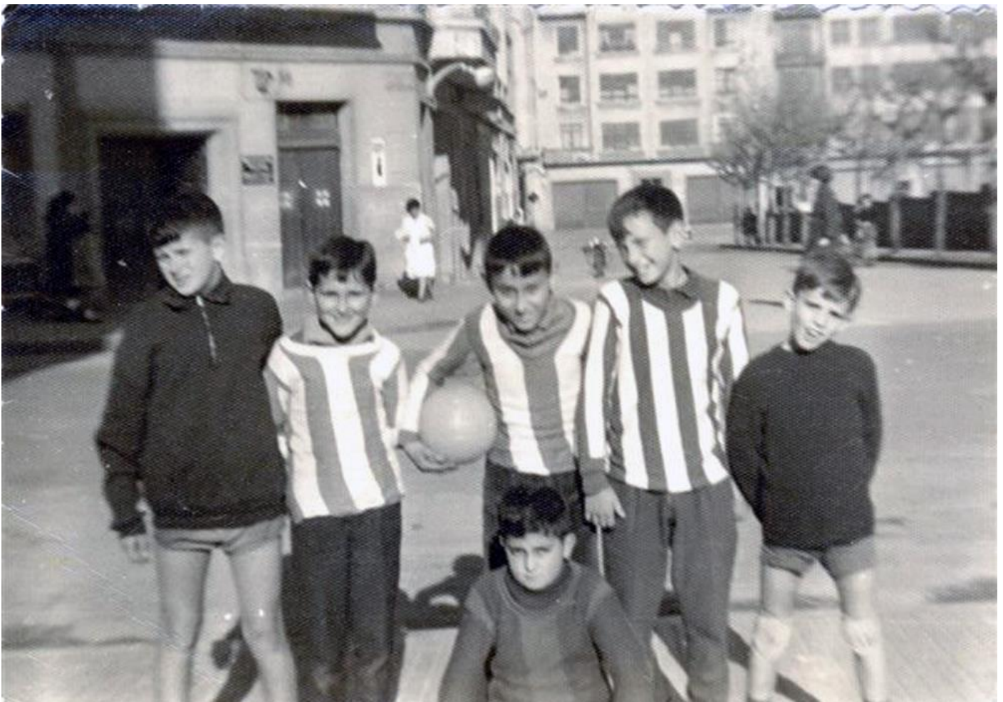
Algunos de los que formamos el "equipo de redacción" de Lepanto