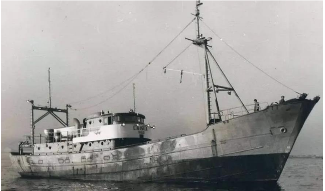
1970. El pesquero “La Isla”

El 4 de octubre de 1970, cuando aún no se habían cumplido las cinco de la madrugada, el pesquero “La Isla” embarrancó en la “Pedra do boi”. Fue una de las grandes tragedias marítimas acaecidas en nuestras costas.