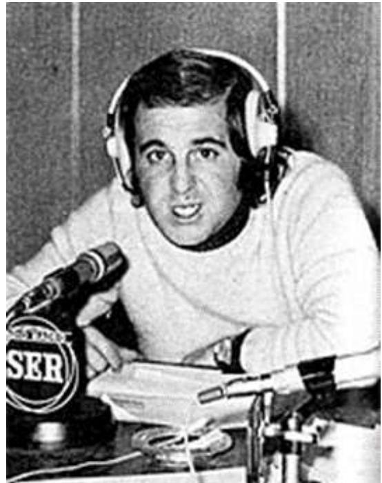
El periodista José M a García